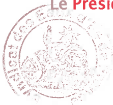
André SANTINI Ancien Ministre

Le Président du Syndicat des Eaux d'Ile-de-France